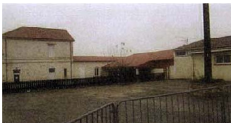
École et salle des fêtes Cantine