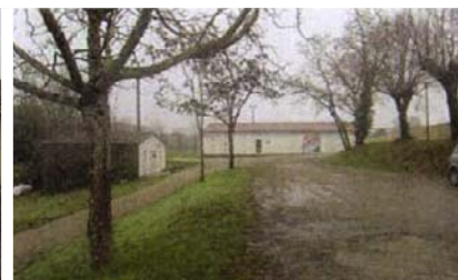
Salle des associations