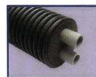
Tubes PE Pré-isolés