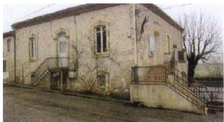
Mairie Ecole maternelle